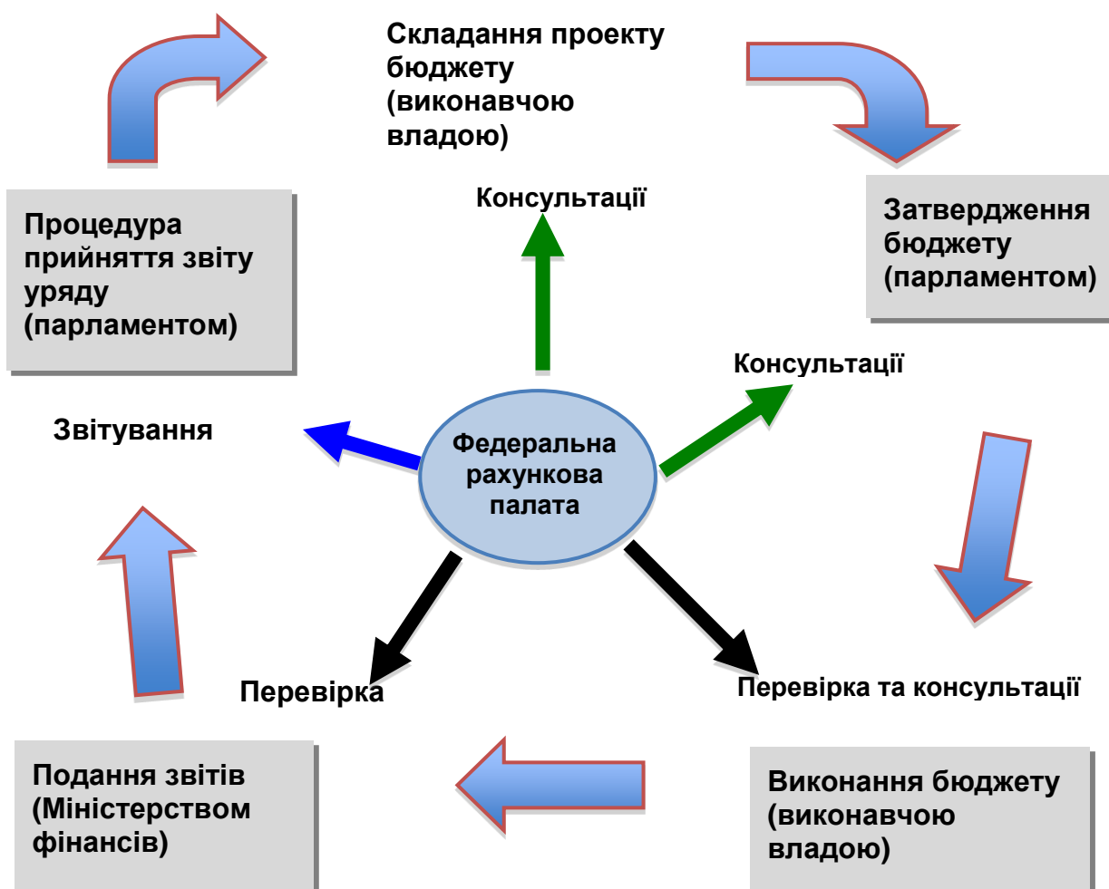
Рис. 1. Бюджетний процес і участь Федеральної рахункової палати

Цикл, зображений на рисунку 1, повторюється з року в рік. Стрілка, що показує перехід від процедури прийняття звіту до процедури складання проекту бюджету, наочно вказує на те, що висновки, отримані Рахунковою палатою за результатами перевірок, які знаходяться в її звітах, - це не тільки основа для прийняття рішення про прийняття звіту виконавчої влади. У цих висновках уряду пропонуються також рекомендації та ініціативи щодо складання наступного проекту бюджету, які, крім цього, також можуть допомогти парламенту під час проведення консультацій щодо проекту бюджету та його прийняття.